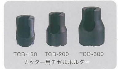
TCB-130 TCB-200 TCB-300 カッター用チゼルホルダー