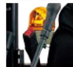
RX-205 CR 定格荷重 (標準アーム、0.06m 3 バケット付)