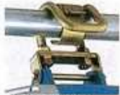
足場パイプ用フック (オプション)